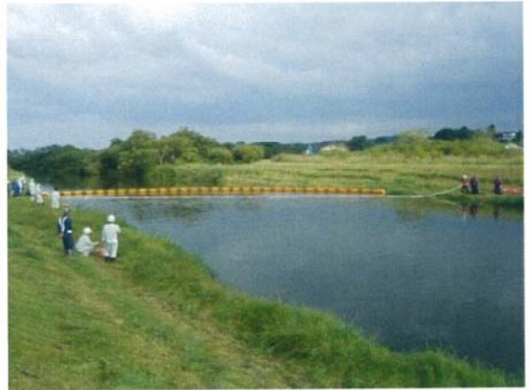
吸水マットによる油回収訓練