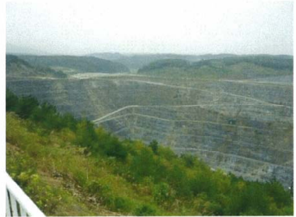
展望台から見た採掘場の様子