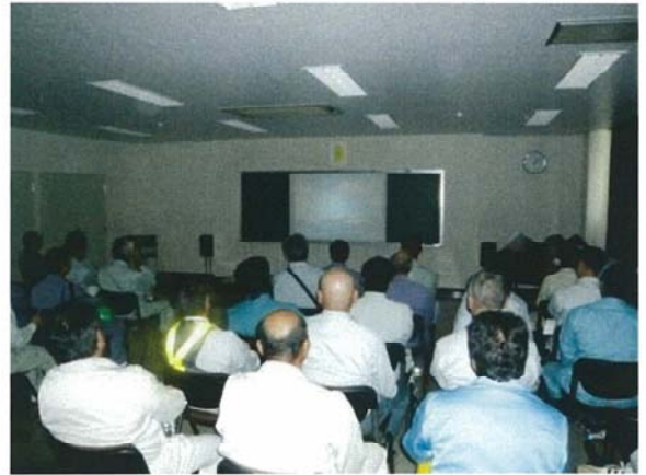
業務内容、工場規模等の説明