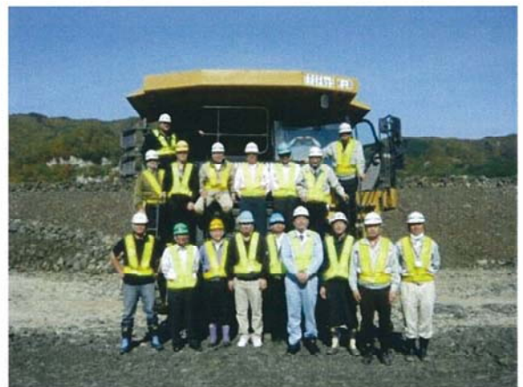
参加者全員にて記念撮影