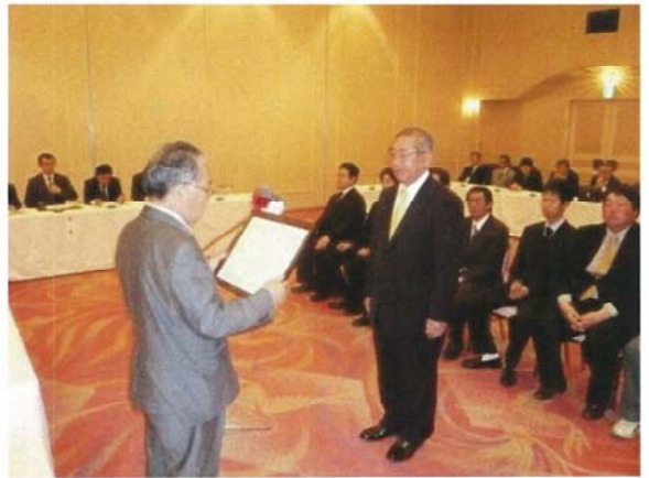
表彰される 優良事業所様