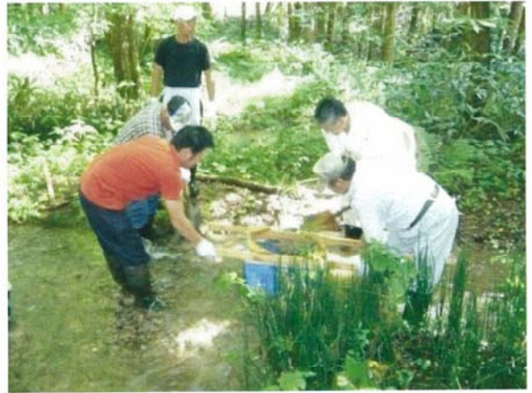
イワナの産卵床づくりの様子