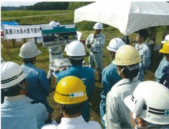
小水路(路面)による油回収実演