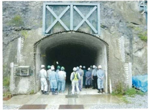
採掘現場見学の様子