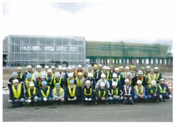
参加者全員にて記念撮影