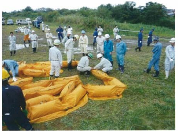
オイルフェンスの組立訓練