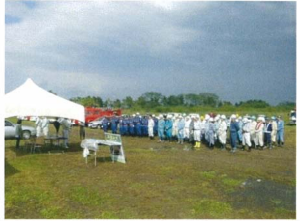
説明を受ける参加者