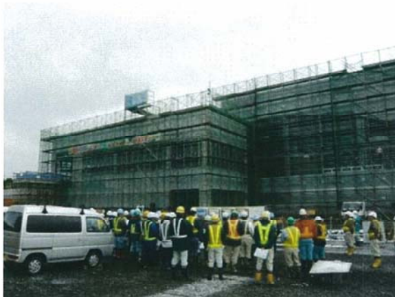
七戸駅(仮称)作業所

平成21年4月27日(月)9:30より、「現場見学会」を開催し、東北新幹線建設現場の七戸駅(仮称)作業所と青森駅作業所の現場見学を行いました。