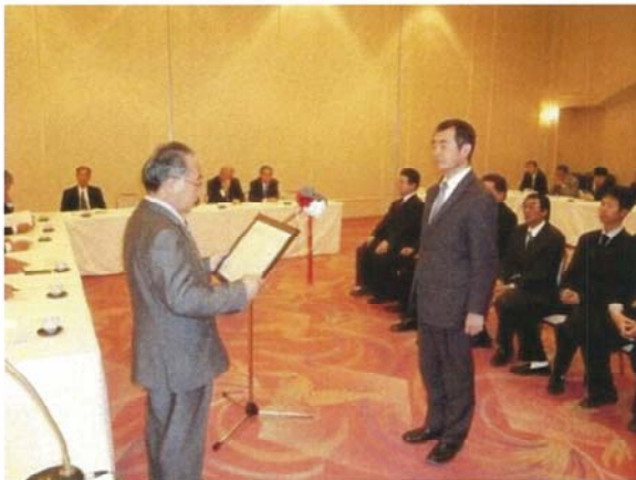
表彰される 優良事業所様