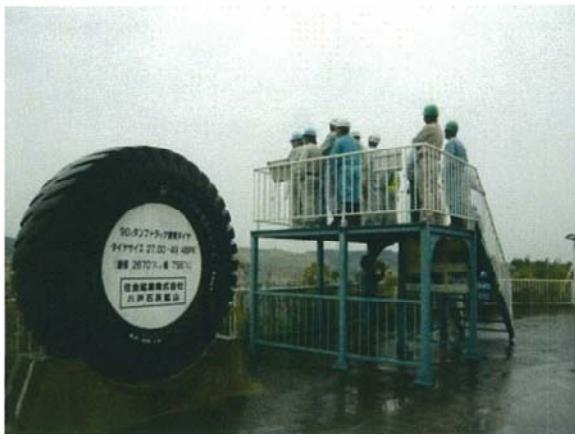
採掘現場見学の様子