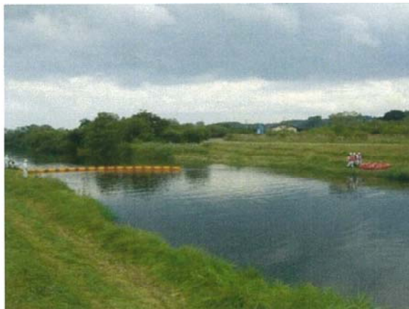
オイルフェンスの設置訓練