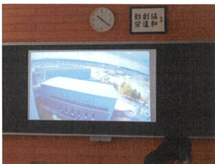
足場の最上階からリモート