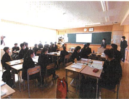
建築科 23名を4班にグループ分け