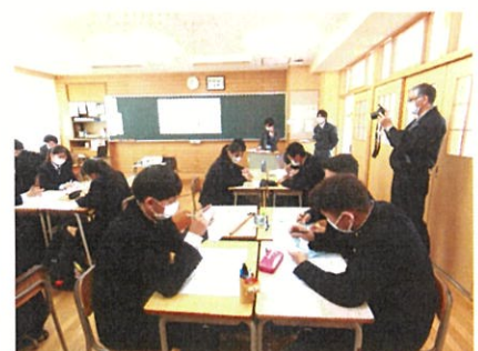
進路を考えるワークショップ (自分の生き方を設計)