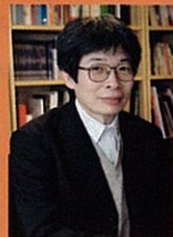
平田 オリザ 氏