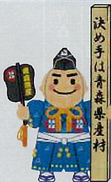
県産品PR用 イメージキャラクター 「決め手くん」