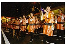
青森ねぶた凱立会 ねぶた囃子