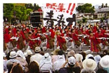
AOMORI花嵐桜組 YOSAKOI 演舞 未来光輝“HAYABUSA” ~轟轟凜然! 青森力!!