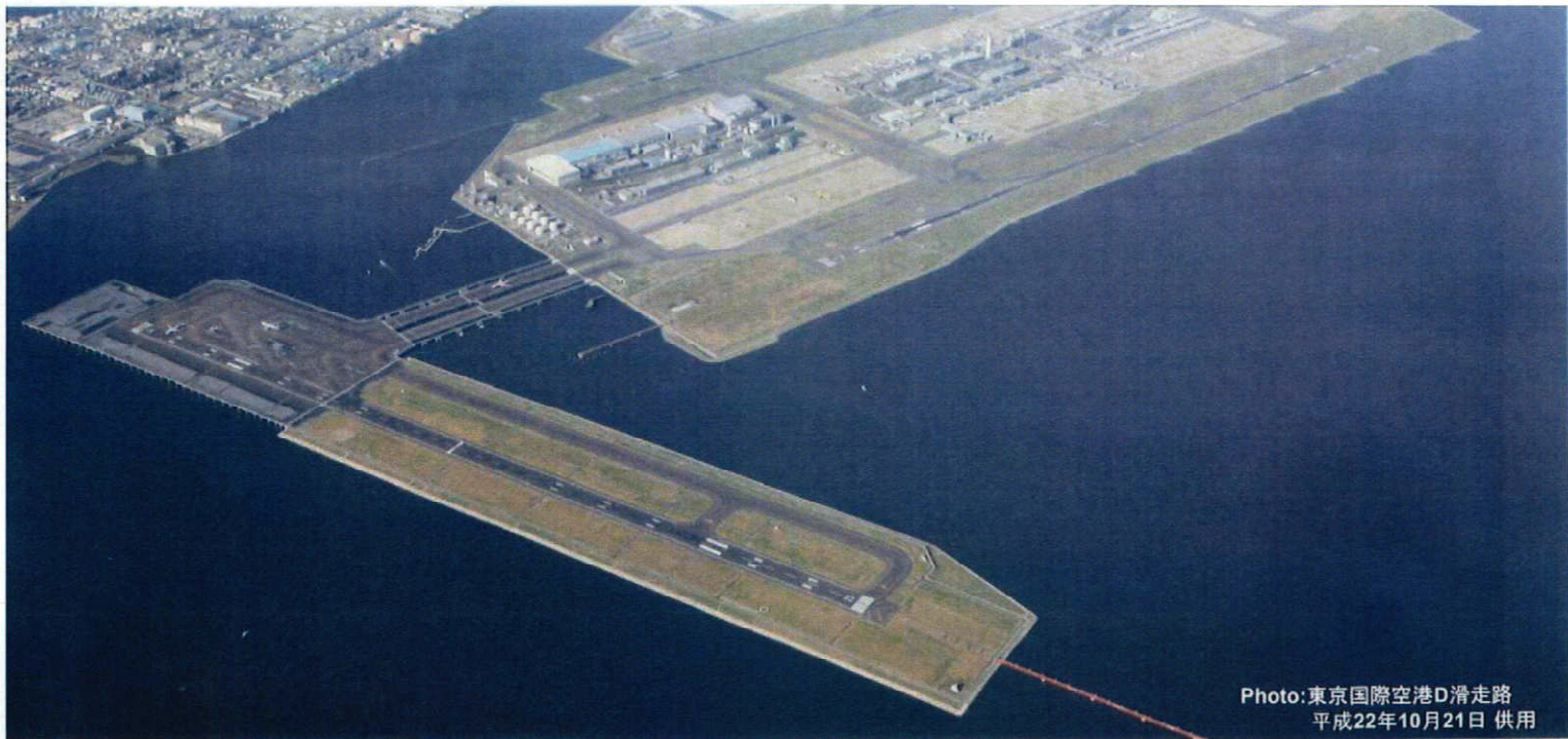
Photo:東京国際空港D滑走路 平成22年10月21日 供用