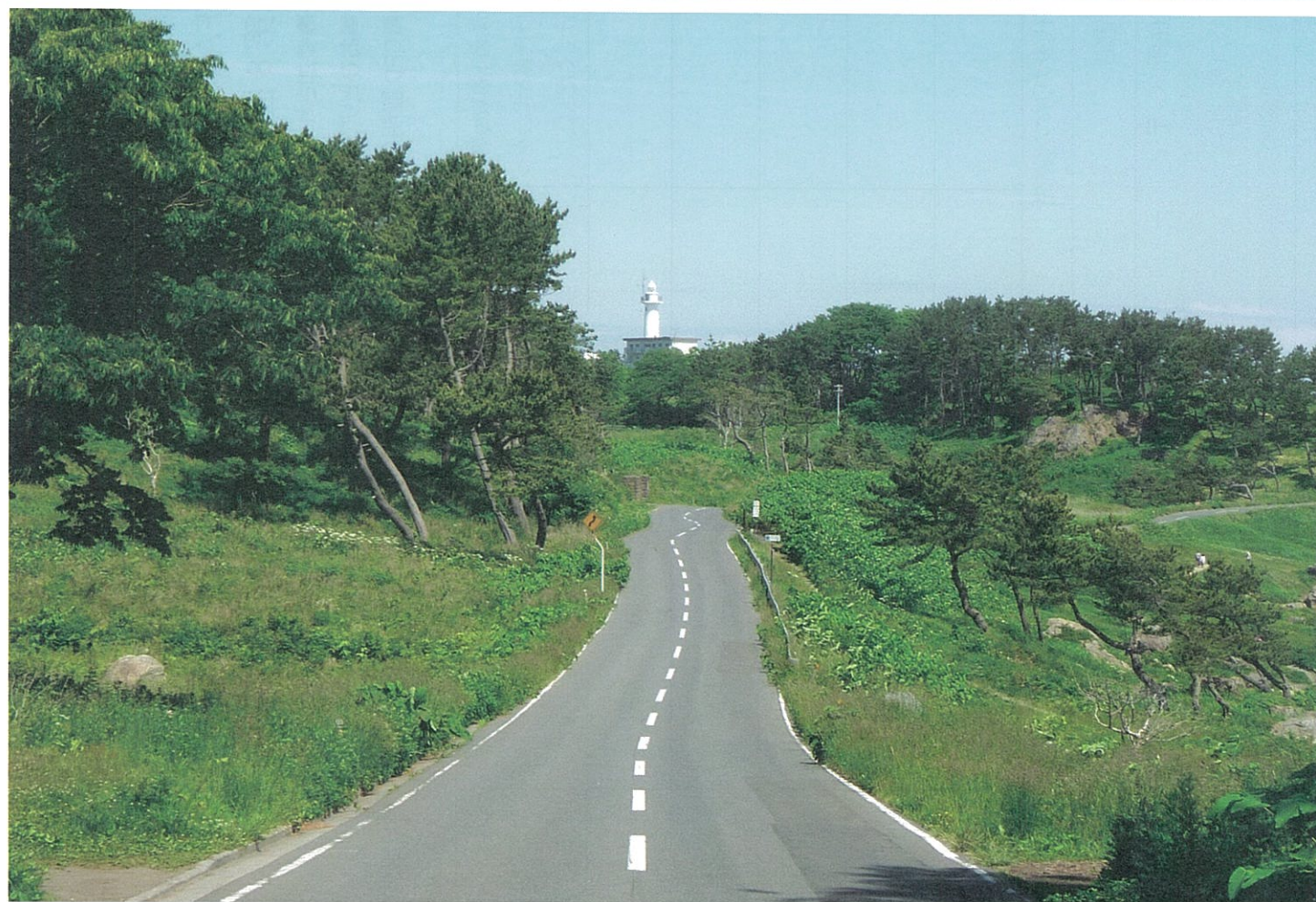
日本の代表的画家、東山魁夷が「道」(昭和25年日展出品)を描いた種差海岸の県道1号八戸階上線