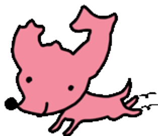
あおりふるさと寄附金 PRキャラクター ムッチャン