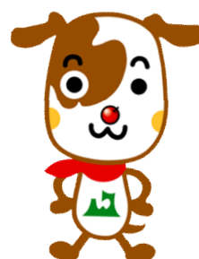
あおりふるさと寄附金 PRキャラクター ハコくん