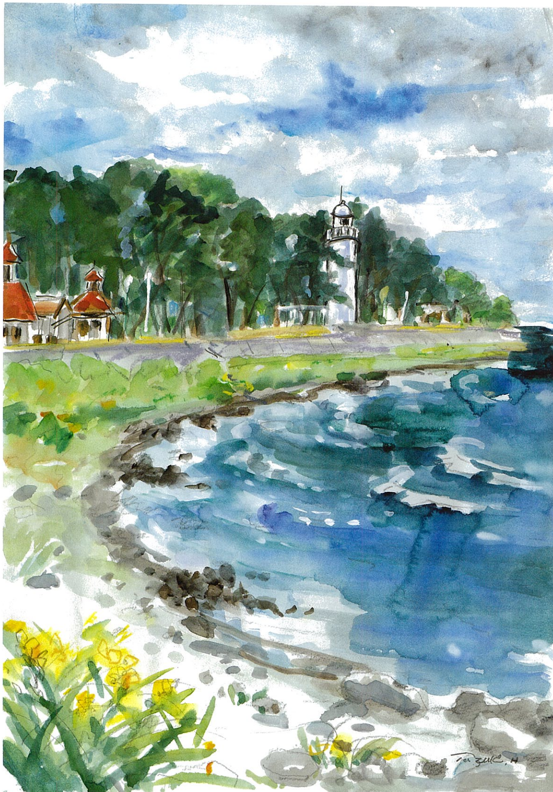
初夏の灯台(平館) 張山 由鷗子