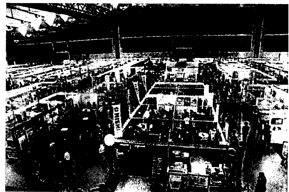
▲前回新技術展示会の様子