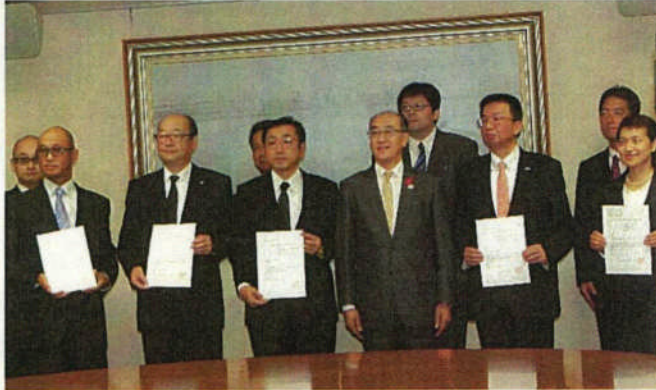
新規認定者に対する 認定書交付式