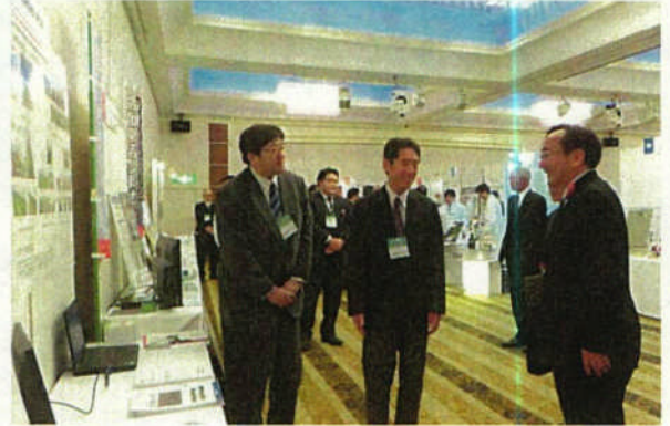
認定事業者による 展示会の開催(八戸市)