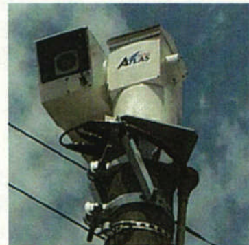
上北地域整備部(野辺地川)等で設置 超高感度ハビジョンカメラ搭載高精細監視 カメラシステム(多摩川精機(株))