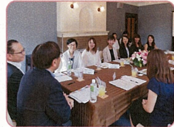
■ 7月 知事との意見交換