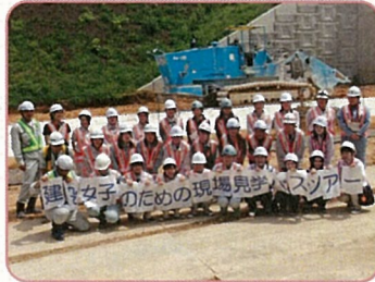
■ 7月 建設女子現場見学ツアー