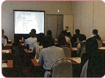
■ 6月 キャリアセミナー

当会議は青森県的女性建設技術者・女性建設技能者で構成された組織であり女性建設技術者を取り巻く環境の改善につなげる取組み・次世代への啓蒙活動を行っています。